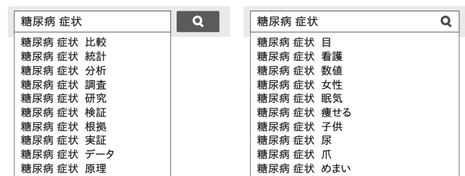
(a) クエリプライミング on クエリ補完

本稿では、認知心理学の分野で明らかにされているプライミング効果に着目し、クエリ入力時に情報精査を促す語を提示するクエリプライミングを提案する。プライミング効果とは、先行する刺激（プライム）の処理が後の刺激の処理を促進または抑制する効果のことを指す [5]。プライミング効果を示す著名な実験として「フロリダ効果実験」が挙げられる [6]。この実験では、被験者の一部に高齢者を連想させるような単語（フロリダ、忘れっぽい、ごま塩、しわ等）を使って作文をさせた。その直